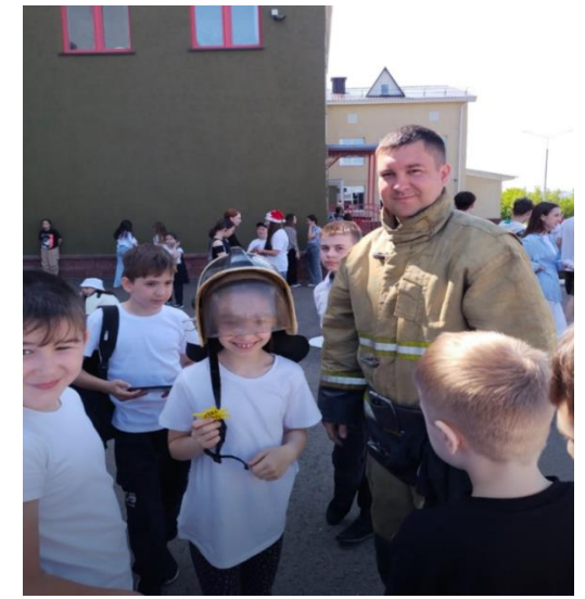
Тренировочная пожарная эвакуация

И, конечно же, развлекательные мероприятия , которые проходили каждый день как на территории лагеря, так и за его пределами!