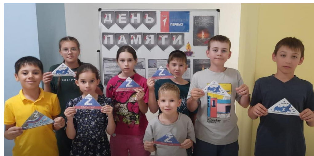
Акции ко Дню Памяти и скорби «Талисман добра», «Письмо солдату»