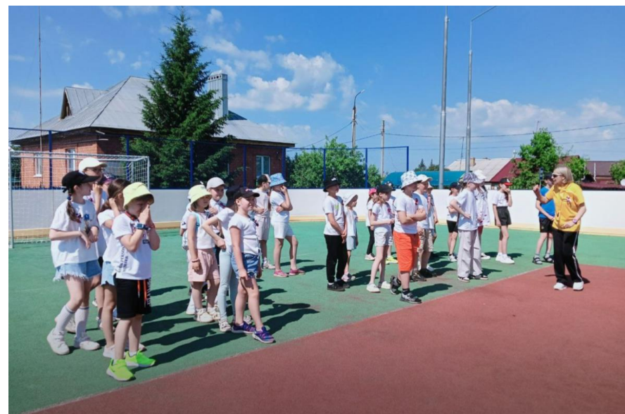
«Интеллектуальный биатлон «Открой Россию!»