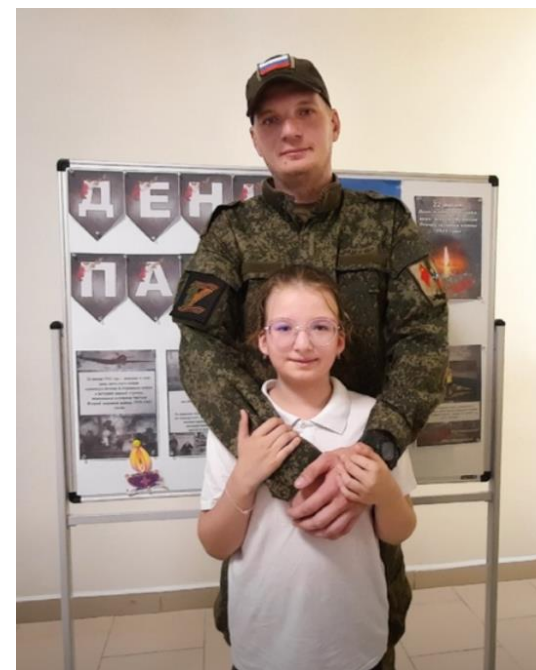
Общелагерное мероприятие. «Светлая память: встреча с историей».