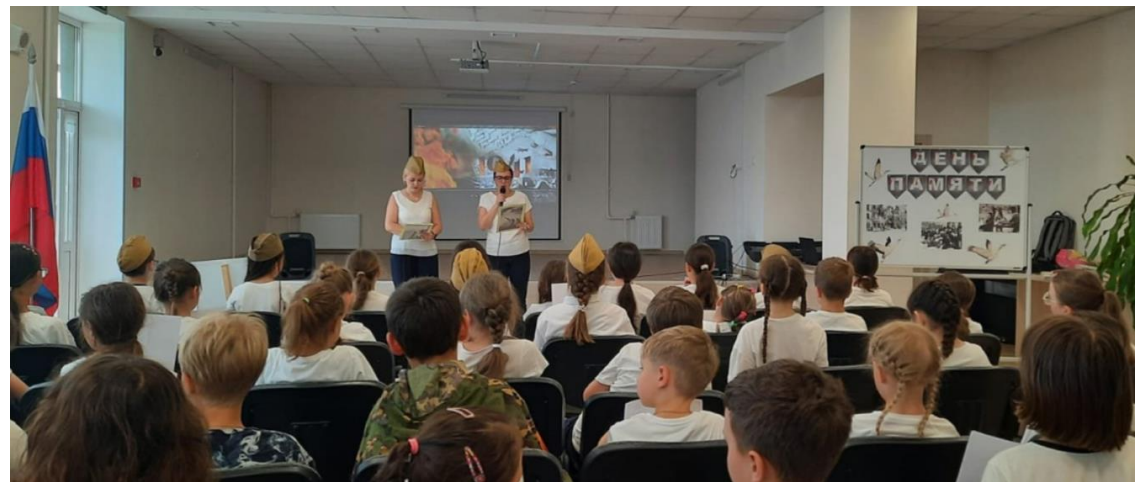
Митинг- линейка, посвященная Дню Памяти и скорби