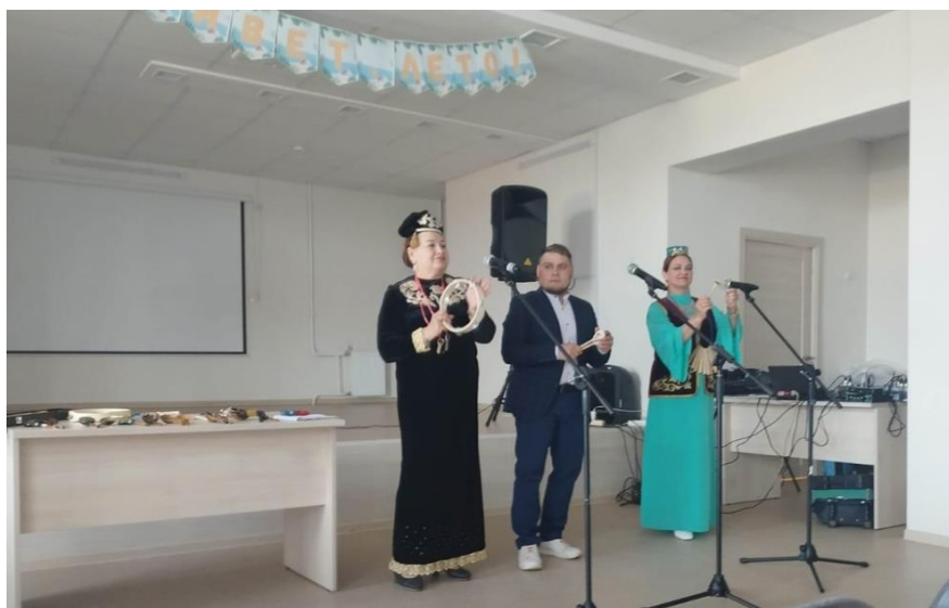
Мероприятия с клубом «НУР»