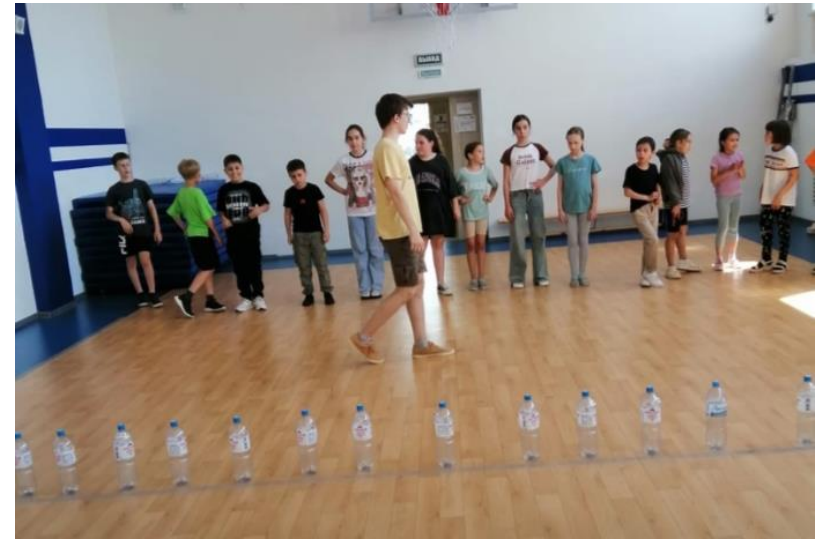
Игра-соревнование «Сила Первых»