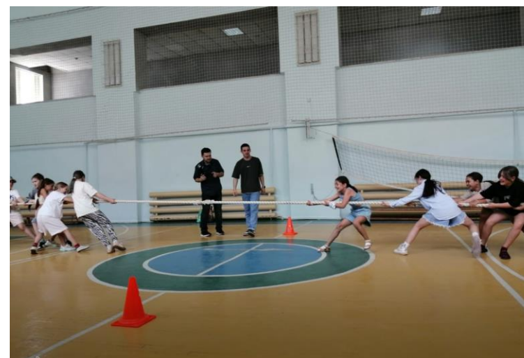
«Неделя детства в Нефтяном (УГНТУ)»