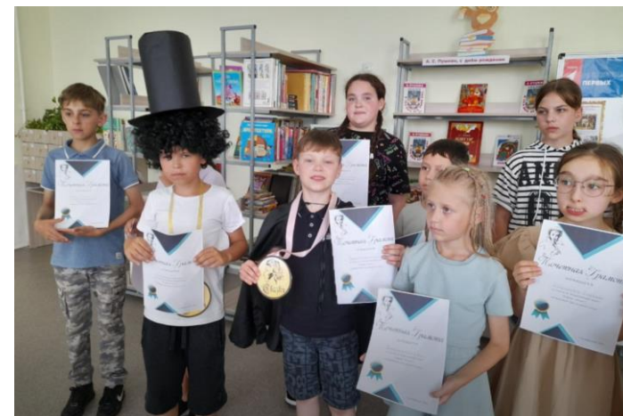
Пушкинский день в России, День русского языка