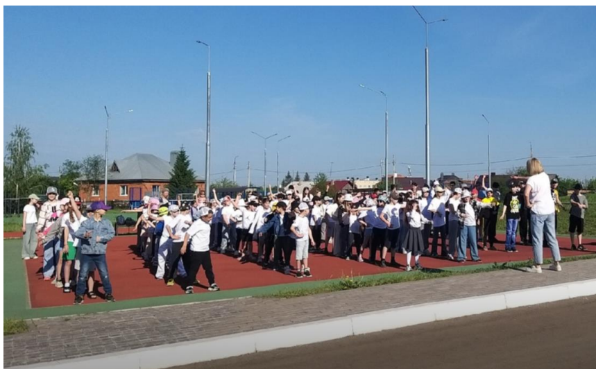
Ежедневная зарядка на свежем воздухе