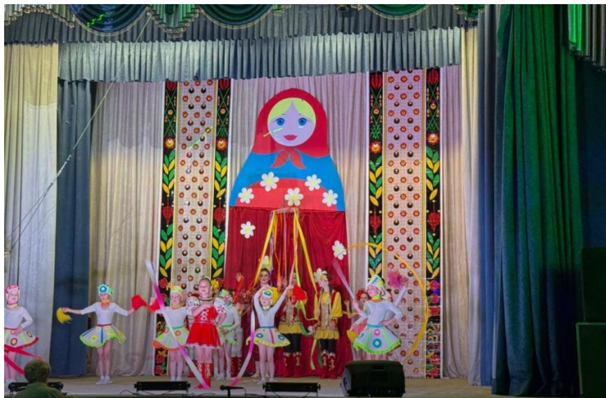
Представление в ДДиЮТ