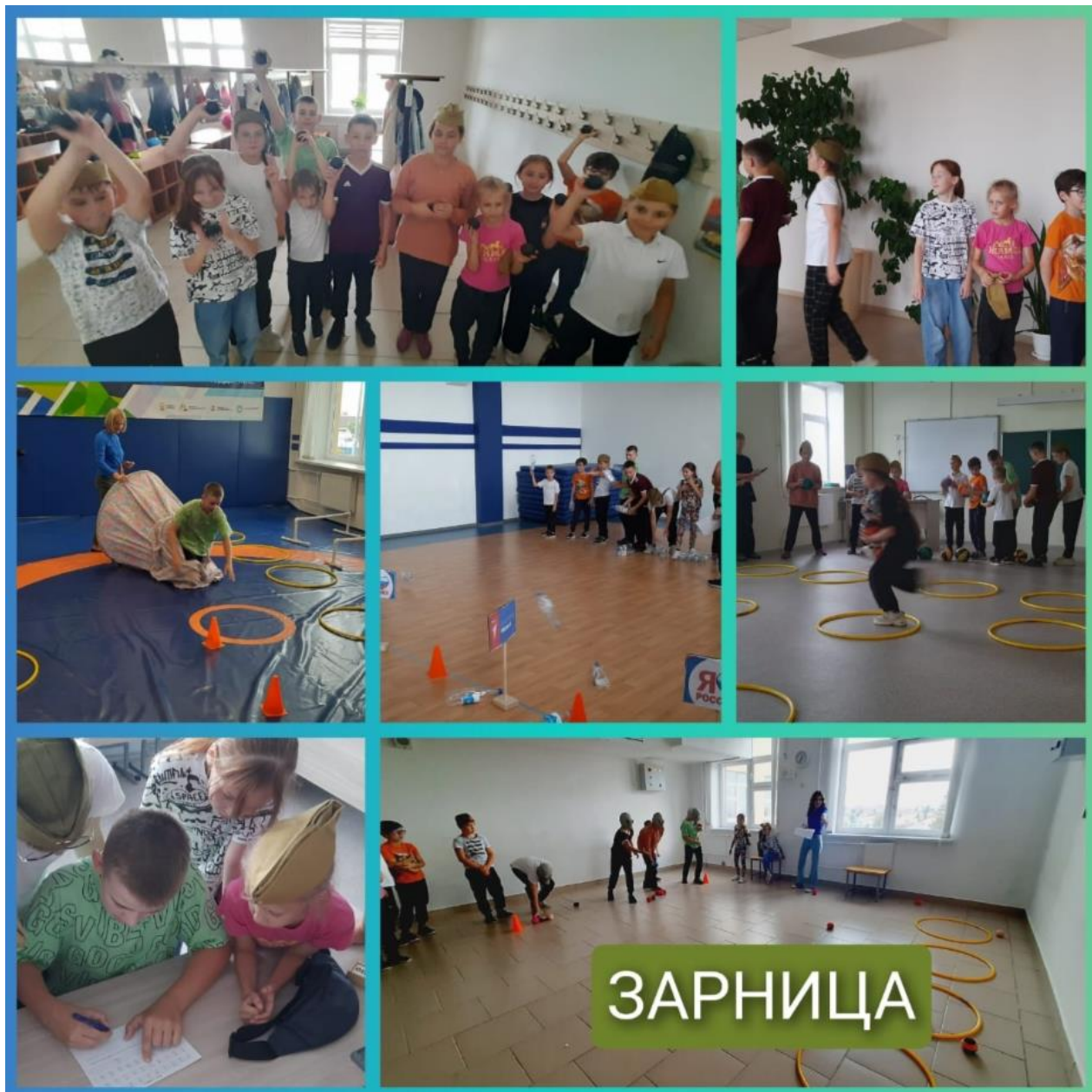
Военно- патриотическая игра «Зарница»