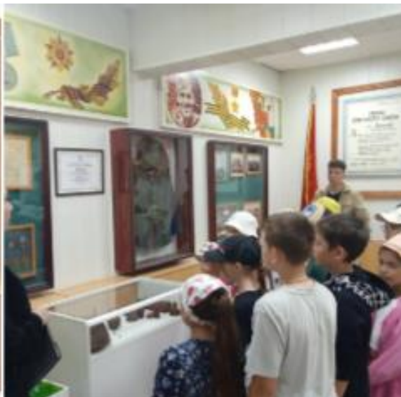
Посещение музея им.Т.Л.Нуркаева