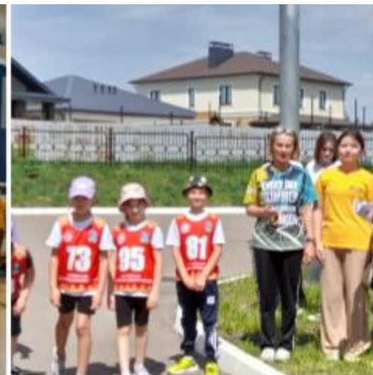
Выполнение норм ГТО