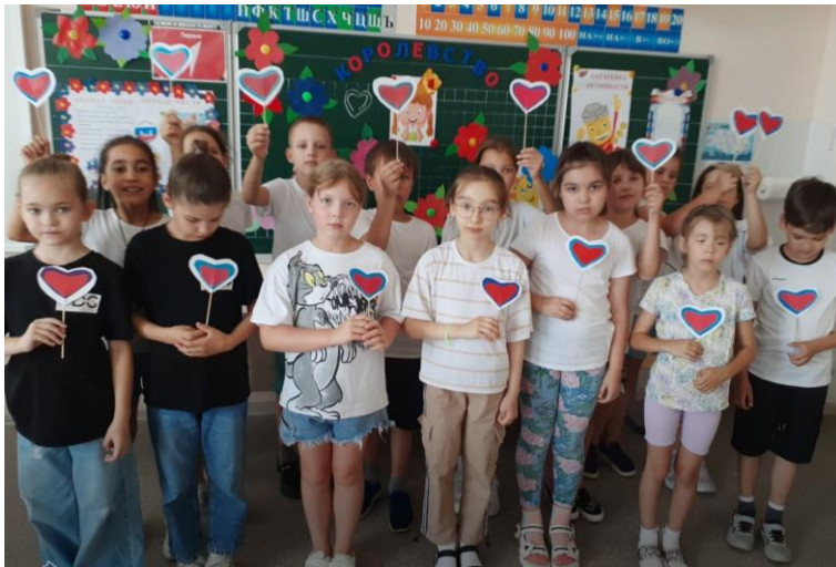
Флешмоб "Россия - Родина моя!"